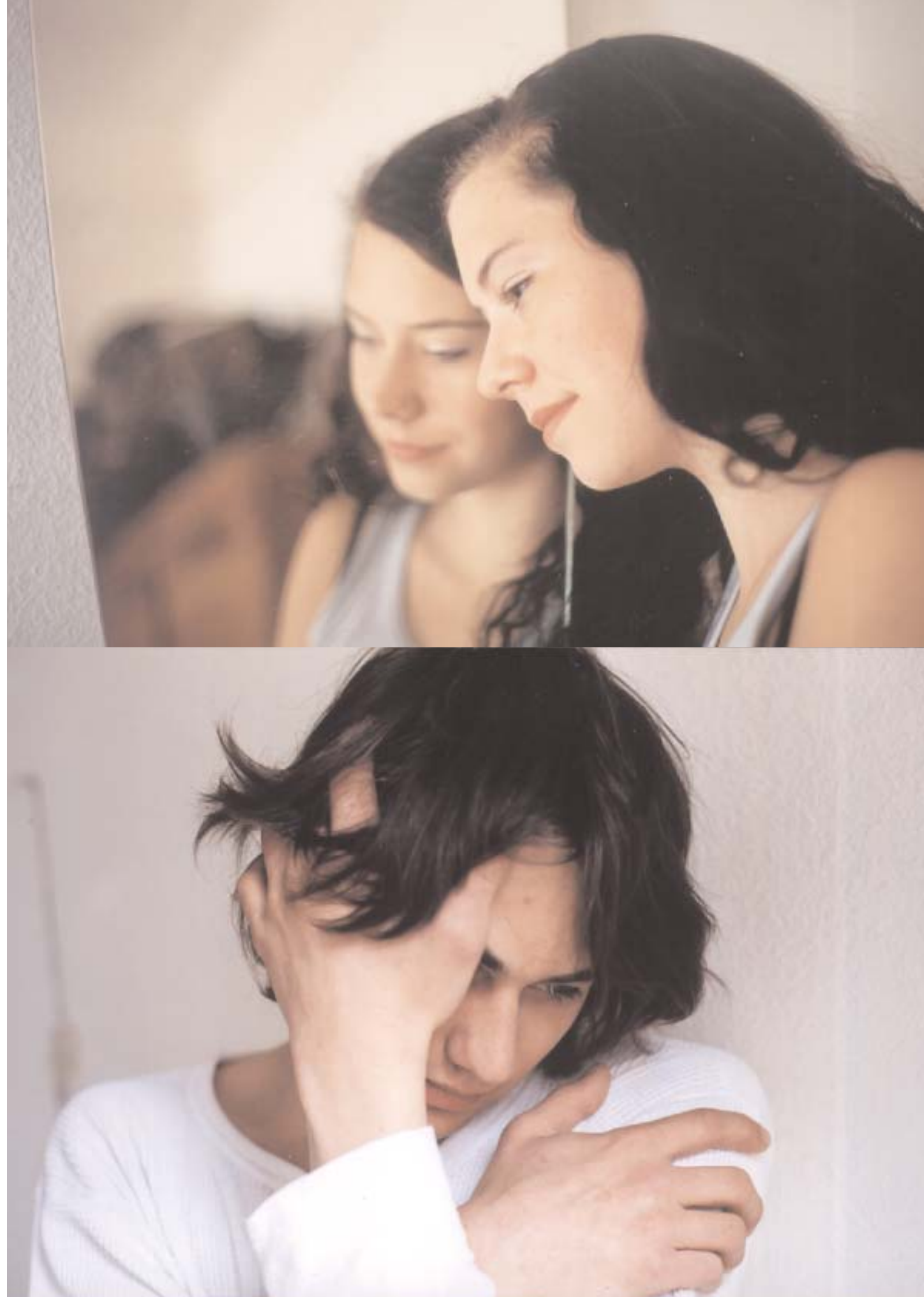
Suchtprävention, laut & leise, Juni 2002