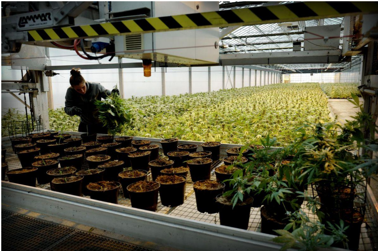
Der Boom hielt nur kurz an: Eine CBD-Anlage in Genf Ende 2018.

Als 2016 der erste CBD-Shop in der Schweiz eröffnet wurde, erlebte die Branche einen regelrechten Boom. Alle wollten in den lukrativen Anbau einsteigen: Während Anfang 2017 erst fünf Unternehmen als CBD-Hersteller registriert waren, lag diese Zahl Ende 2019 bei 650 Unternehmen. «Vielerorts wurde erheblich in den Indooranbau investiert», schreibt das Forensische Institut.